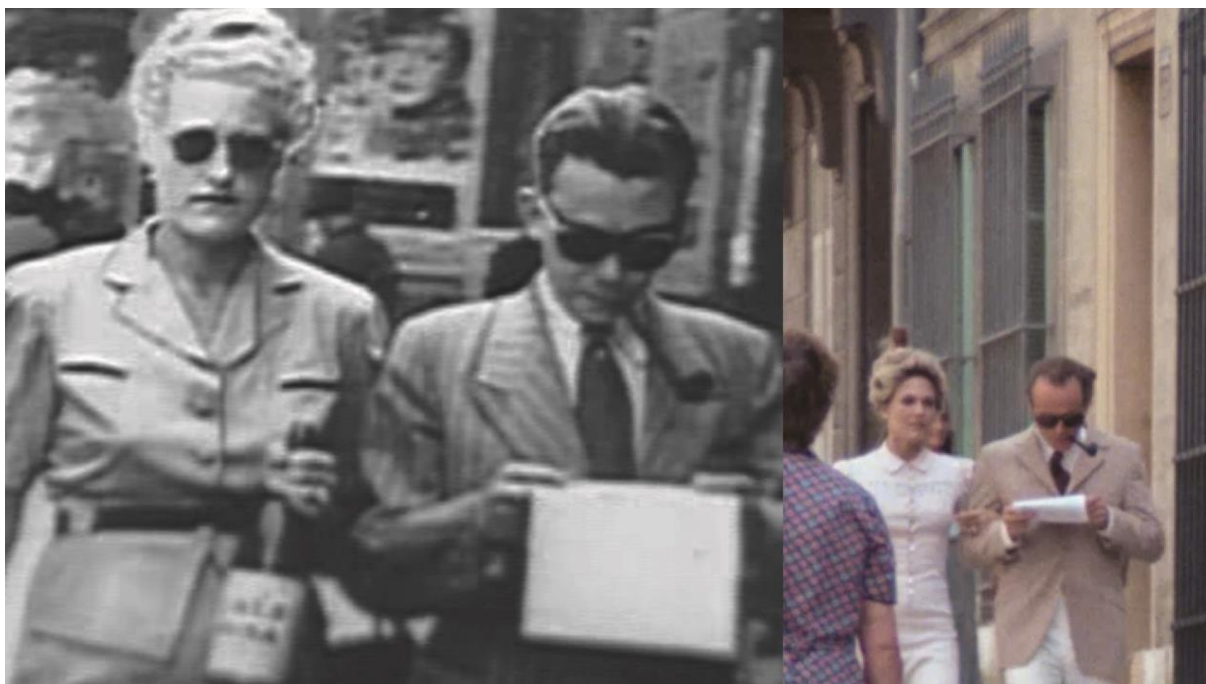
Fotos der Roten Kapelle dienten als Vorlage für die ARD-Serie über die Rote Kapelle. Die Darstellung der Gestapo war allerdings so geschönt, dass die Ausstrahlung im französischen Fernsehen nach unzähligen Protesten abgebrochen wurde.